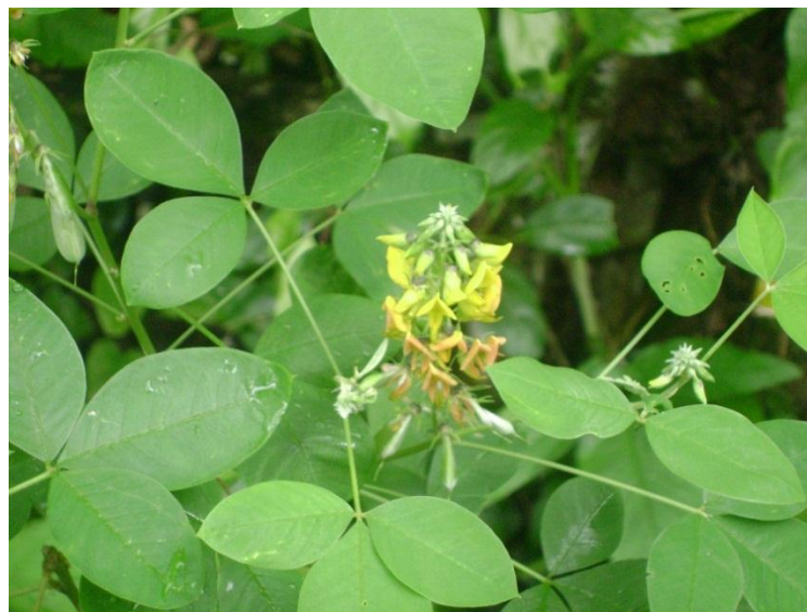
Figura 7. JCS 28078: Crotalaria longirostrata (Leguminosae).