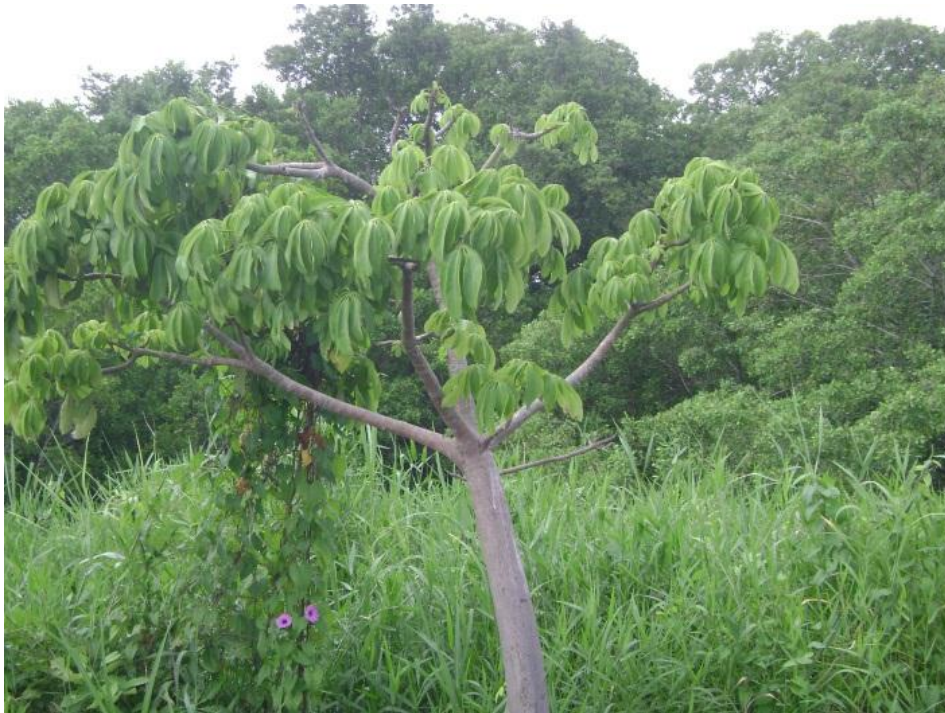
Figura 4. JCS 27593: Pachira aquatica (Bombacaceae).