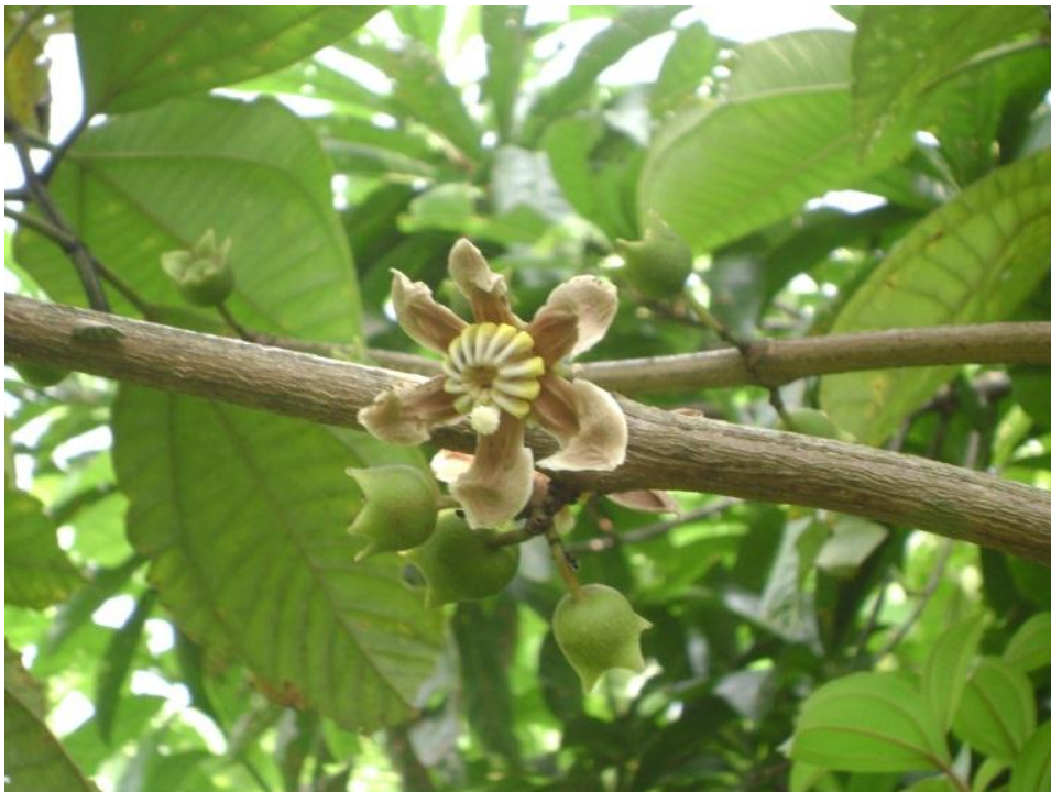
Figura 5: JCS 27737. Bellucia pentamera (Melastomataceae).