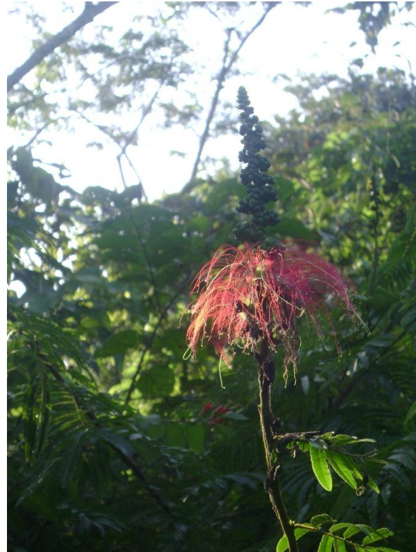
Figura 6. JCS 27680: Cactaceae sobre árbol, y JCS 28049: Calliandra houstoniana (Leguminosae).