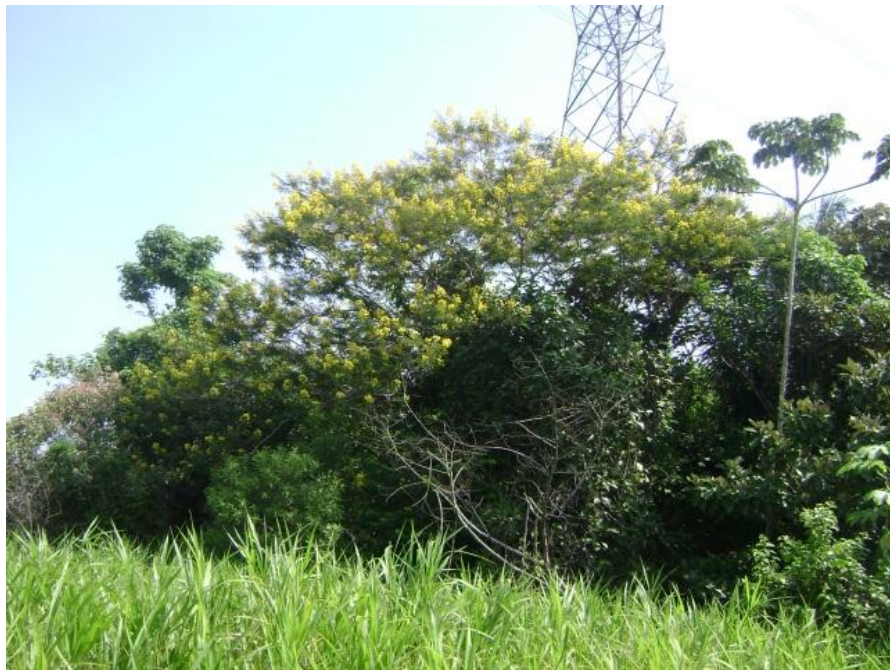
Figura 3. JCS 27560: Senna multijuga (Leguminosae).