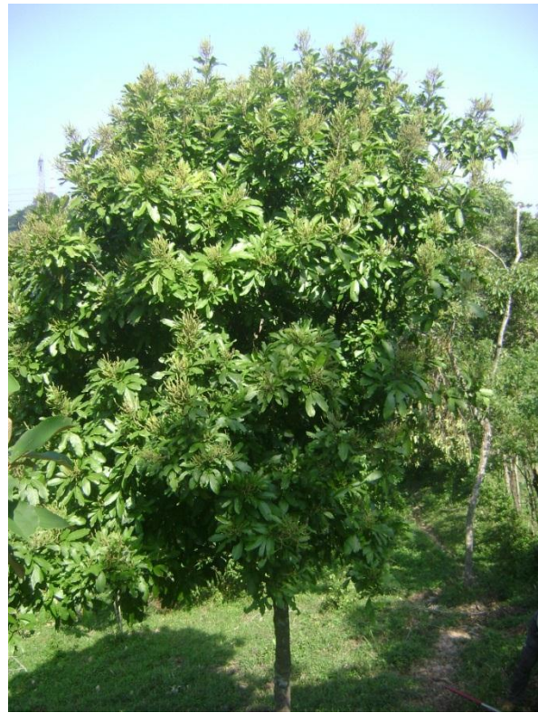
Figura 8. JSC 28087: Paullinia costata (Sapindaceae), y JCS 28201: Cupania glabra (Sapindaceae).