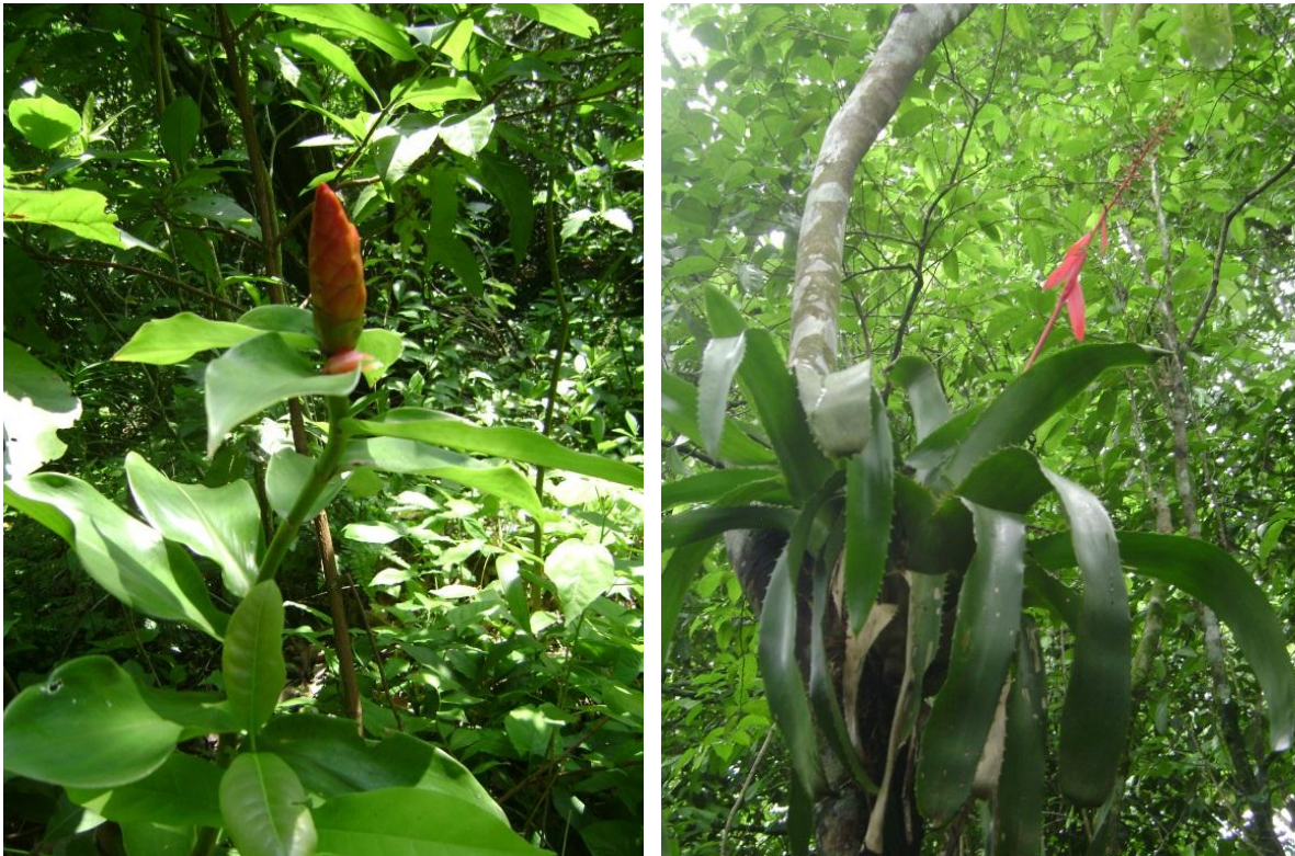
Figura 2. JCS 27542: Costus scaber (Costaceae), y JCS 27625: Aechmea bracteata (Bromeliaceae).