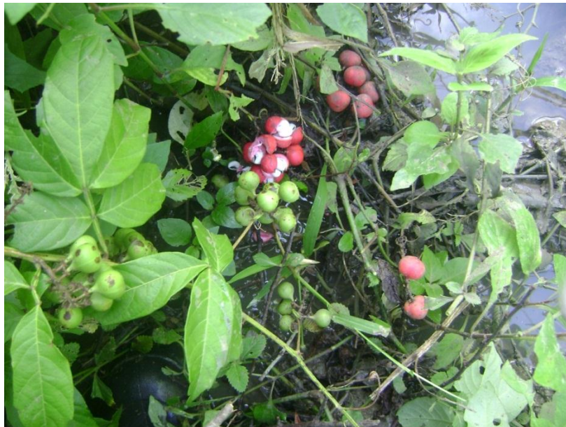
Figura 9. JCS 28115: Paullinia pinnata (Sapindaceae).